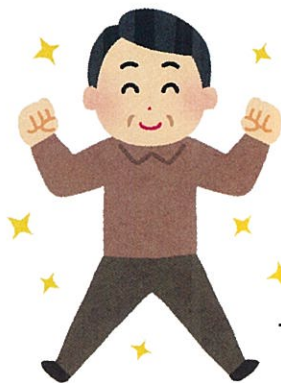
サポーター登録者