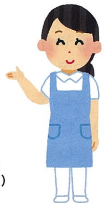
受入機関 (施設職員)