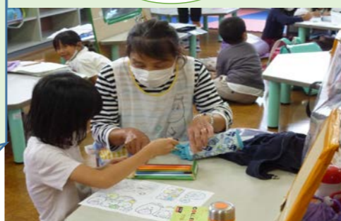
(三光コミュニティーセンターに併設の三光児童館)

大分市で子どもに関わる仕事をし、退職を機に地元に戻ってきました。暫く家でゆっくりしていましたが、近くに児童館があるのを知り、体調に無理のない程度に、経験を生かして再びボランティアで子ども達に関われればと思い、一緒に遊んだり、見守りをさせて頂いてますが、日々子ども達からパワーをもらえ、私にとって、生きる糧となっています。