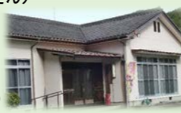
(上深水多目的集会所)

三光上深水地区の高齢者の方を対象に、上深水多目的集会所で、月1回第4水曜日に実施する上深水サロン。コロナで少しお休みした後の久しぶりのサロンの日。今日はサポーターさんもメンバーとなっている「ほほえみ演芸座」を招いて、マジックや踊り、ハーモニカの演奏を鑑賞したり、誕生月の方にプレゼントを渡す等して楽しみ、みんな久しぶりの笑顔がこぼれていたようです。