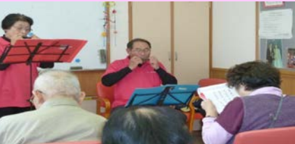
山国生活支援ハウスにて

趣味が生かせればと思いはじめてきましたが、みなさんが笑顔で私がお伺いするのを心待ちにして下さり、とてもありがたく、感謝し、その笑顔と姿に元気をいただいています。利用者みなさんから色々リクエストも頂き、それを私が練習して次回訪問時に演奏し、みんなで歌ったりして一緒に楽しみ、私自身生きる活力をみなさんからいただいています。