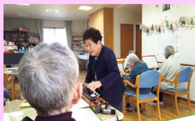
小規模多機能の家「水車」にて

これからも、健康づくりの為、この活動を続けていきたいと思っておりますので、ご要望があればいつでもお声がけ下さい。