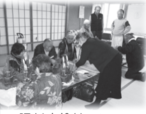
陽だまりサロン（和田校区）