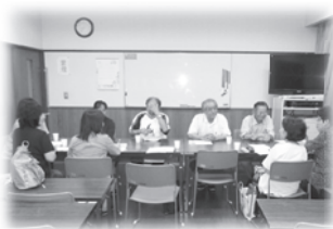
南部地区ネットワーク協議会「ぼけっと」のようす