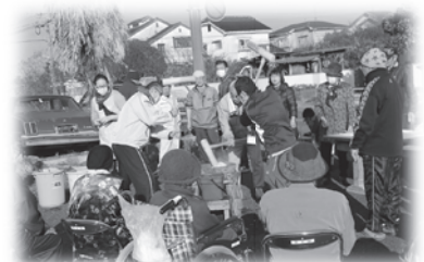
もちつきのようす

また、日頃より、地域ぐるみで見守り声かけの関係づくりが必要!とのことで、東永添壮年親睦会を中心に自治委員や民生委員と連携し、「東永添結(ゆい)の会」を結成し、一人暮らしの高齢者世帯中心に、毎月、見守り声かけの取り組みも行なわれており、地道な活動が心と心を“結”び、共に支え合える地域を目指して、活動を続けていきたいとのことです。