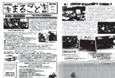
【広報紙、研修会の例】