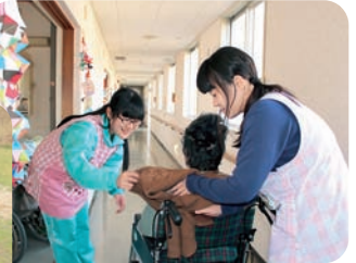
高齢者とのふれあい 「お話や介護体験をしてみませんか？」