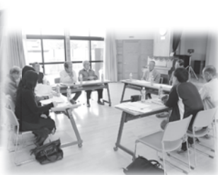
鶴居校区ネットワーク協議会のようす