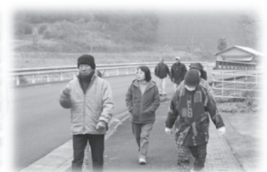
避難訓練のようす