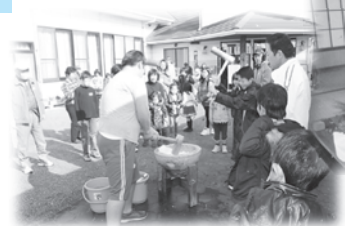
豊田カフェ3世代交流（豊田校区）