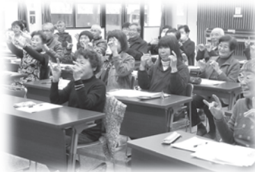
支えあいスタッフ養成研修のようす

城井・津民・山移・深耶馬・下郷の5地区の方々と共に、来年度中の立ち上げを目指し話し合いを重ねています。地域の中での困りごとについてどのように向き合ったら良いのか、どうしたら地域の中で困っている人を見つけることができるのかなど、皆で一緒に検討しています。