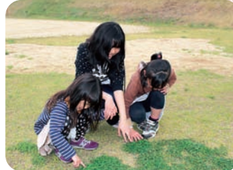
子どもたちとのふれあい 「童心にかえて、子どもと遊んでみませんか？」