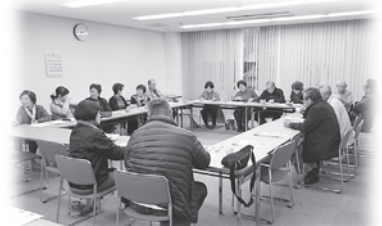
話し合いのようす

山国では「源流の郷、やまくに福祉の会」と話し合いの経過を共有し、平成28年度当初の立ち上げを目標に取り組んでいます。今後は具体的な決め事をスタッフの方々と検討し、先進地の視察も行う予定です。