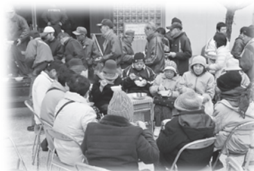
炊き出し訓練のようす

今回の訓練で、災害時どのように行動するかを考えるきっかけとなり、平常時からの地域の支え合いの重要性が再確認できたのではないのでしょうか。