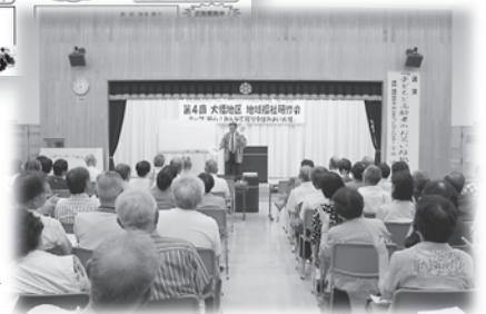
大幡福祉の会“輪”主催研修会のようす