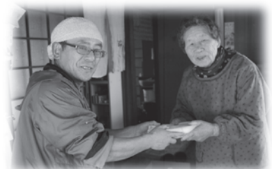
おもちの配布のようす