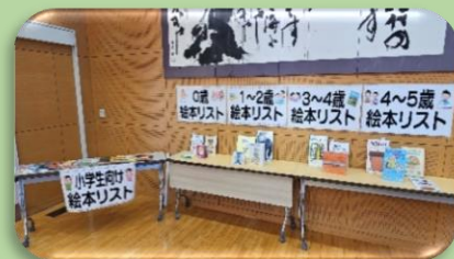
おすすめの絵本コーナー