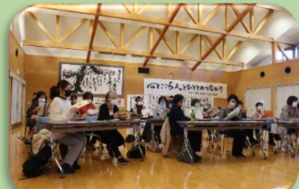
皆さんで絵本を手を取っている様子

ボランティアに興味がありましたら、社協のボランティア・市民活動センターまでお問合せください。 TEL:0979-23-2095